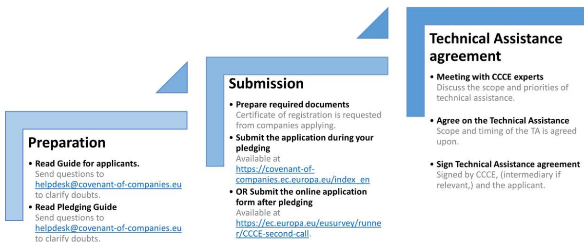
Figuur 3 De aanvraagprocedure bestaat uit drie stappen: TB-voorbereiding, indiening en overeenkomst

De aanvraagprocedure (Figuur 2) bestaat uit drie hoofdstappen: Voorbereiding van de aanvraag, Indiening van de aanvraag en Overeenkomst voor Technische Bijstand (TB).