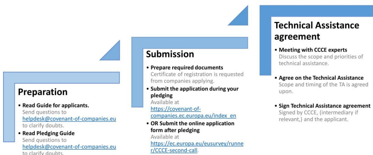
Figure 3 La procédure de candidature se déroule en trois étapes : Préparation, soumission et accord d'AT

Le processus de candidature (figure 2) comporte trois étapes principales : La préparation de la demande, la soumission de la demande et l'accord d'assistance technique (AT).